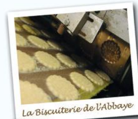
La Biscuiterie de l'Abbaye