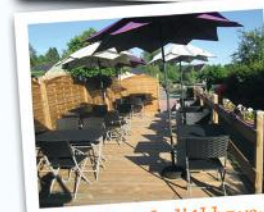
Le Relais de l'Abbaye

Accompagnés d'un guide de l'office de tourisme, découvrez l'histoire et le décor de l'Abbatiale. 3€ - Gratuit enfants