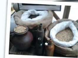
Le Château de la bière

Petite pause dans le restaurant du village (possibilité de manger en terrasse l'été). Formule tout compris à 15€90 : entrée, plat, dessert, 1/4 de vin, café.