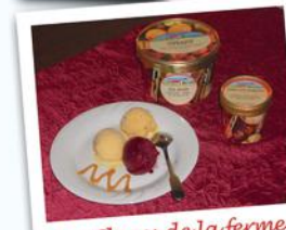
Les Glaces de la ferme

Visitez la brasserie et découvrez la fabrication des bières artisanales de Lonlay. 2€/pers.